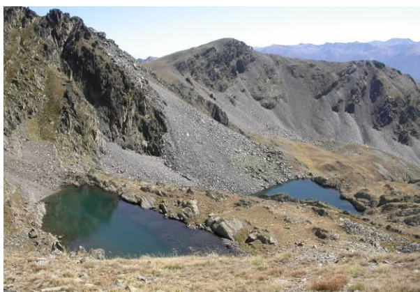
Estanys de Montmantell