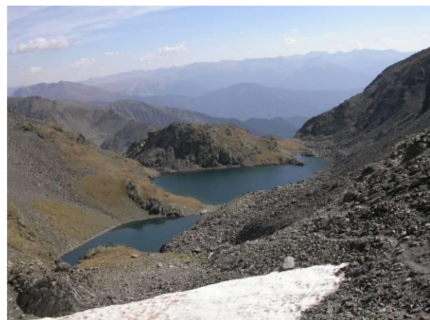
Estanys Forcats (Jordi Nicolau . BIOCOM)