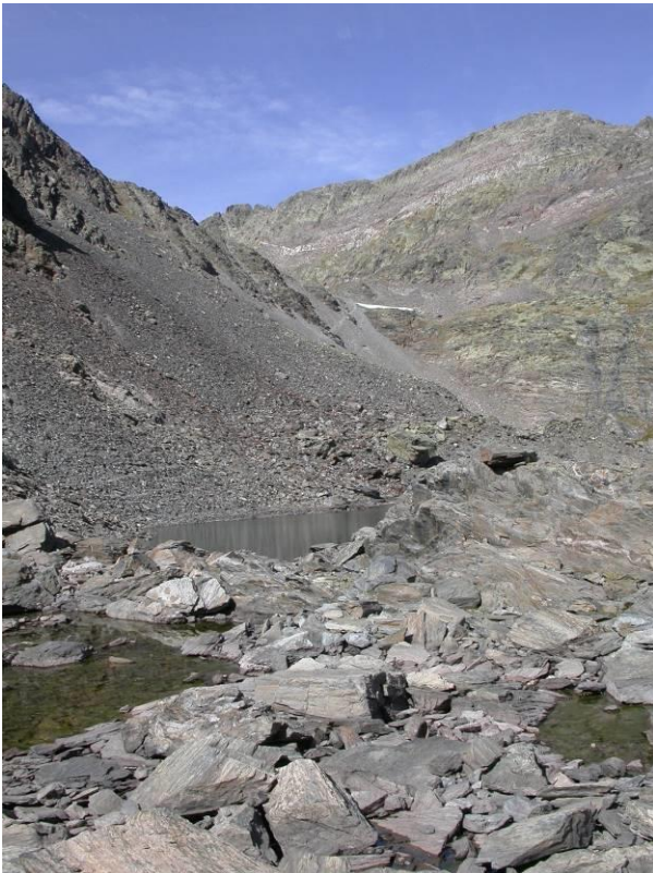
Estanys Forcats

2.- Els estanys Forcats: el conjunt lacustre dels Forcats és el punt final de l'itinerari. Cal tenir en compte, però, que el GR11.1 continua, tot travessant la collada dels Forcats, en direcció al refugi i els estanys de Baiau, ja a Catalunya. El conjunt lacustre dels Forcats està format per l'estany Primer, l'estany del Mig i l'estany de Més Amunt, cubetes de sobreexcavació actualment cobertes d'aigua, i és una de les raconades més espectaculars del parc, quasi irreal.